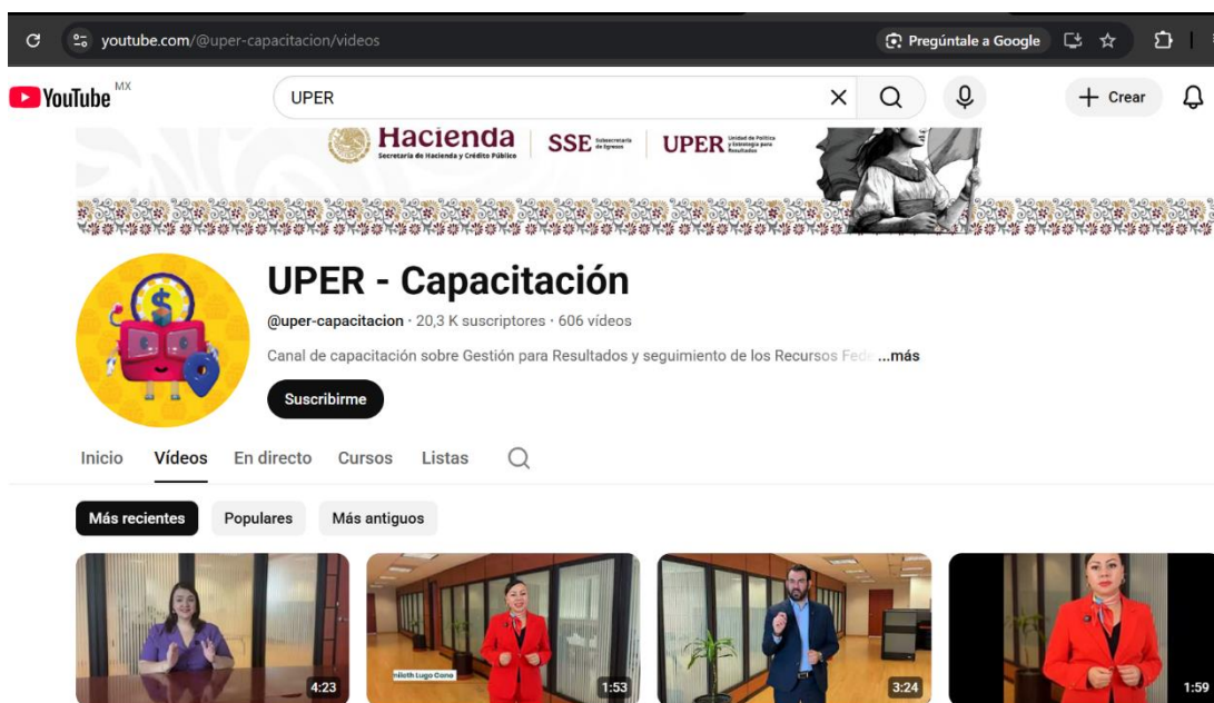
Ilustración 1 Canal de la UPER en YouTube