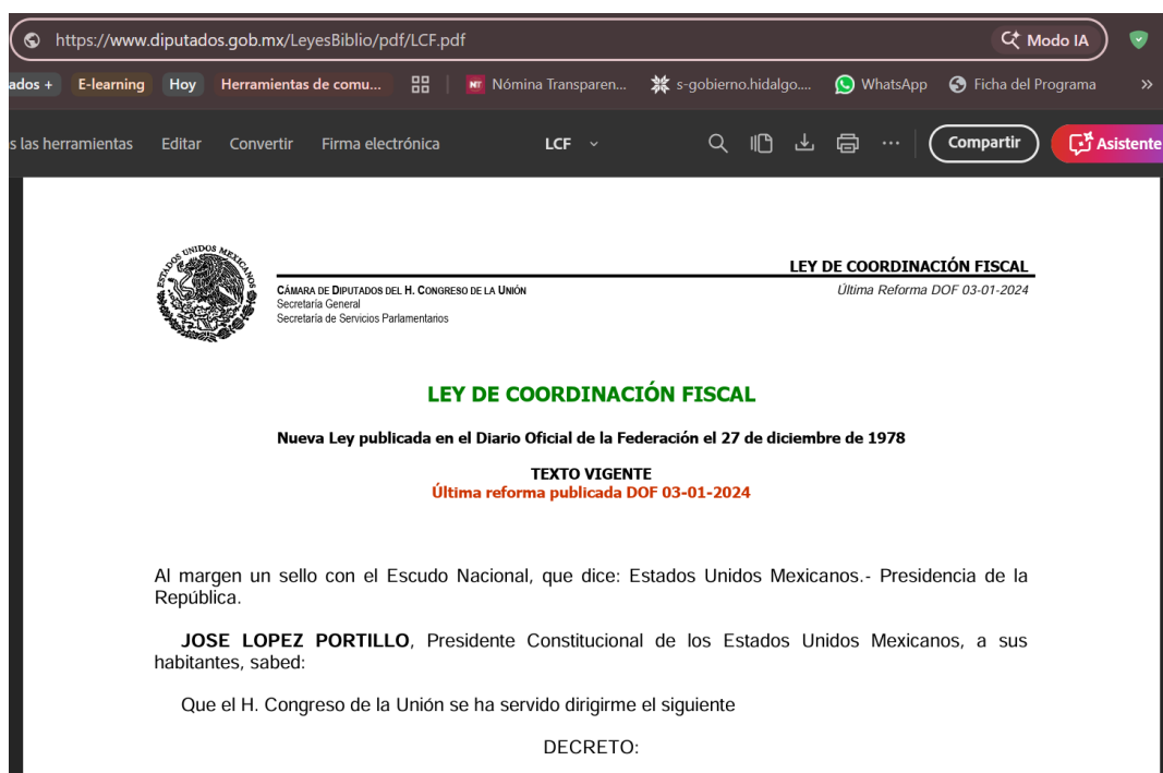
Ilustración 2 Ley de Coordinación Fiscal

Fuente: captura de pantalla con base en Cámara de Diputados del H. Congreso de la Unión, (1978), Ley de Coordinación Fiscal , Última reforma publicada en el Diario Oficial de la Federación con fecha 03 de enero 2024, Fecha de consulta: 02 de diciembre de 2025, Disponible en: https://www.diputados.gob.mx/LeyesBiblio/pdf/LCF.pdf